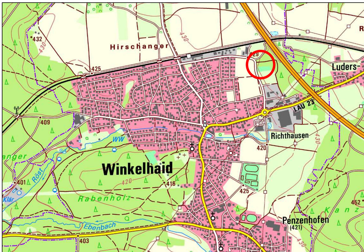
Abbildung 1 Lage im Raum (Kartengrundlage DTK 25, © Bayerische Vermessungsverwaltung 2024) mit Kennzeichnung des Änderungsbereichs

Das Plangebiet ist ca. 1.100 m 2 (0,11 ha) groß und umfasst die Flurstücke Nrn. 169/1 (tlw.), 732/1 (tlw.), 732/9 (tlw.) und 748 (tlw.) in der Gemarkung Winkelhaid. Der exakte Zuschnitt des Geltungsbereichs ergibt sich aus den zeichnerischen Darstellungen.